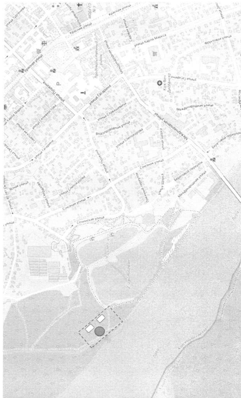
СХЕМА РАСПОЛОЖЕНИЯ КУПЕЛИ

Заместитель главы администрации Лабинского городского поселения